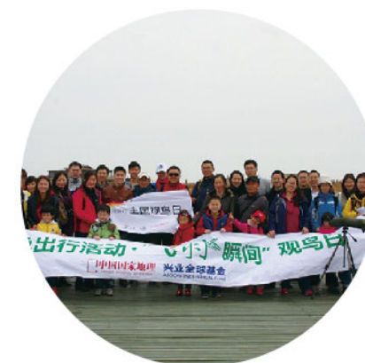
2013年4月，公司员工到崇明岛参加观鸟活动