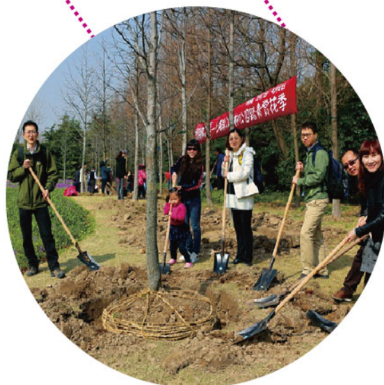
2013年，阳春三月，公司部分员工赴上海共青森林公园植树