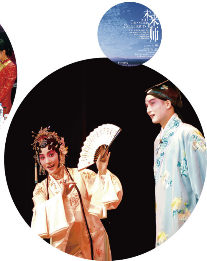
名家名剧月之《牡丹亭》