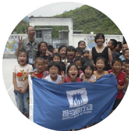
担当者行动及班班有个图书角都深受广大贫困地区师生的欢迎