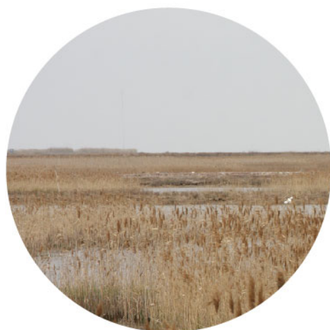
首届全国观鸟日，兴业全球基金携手中国国家地理举办“绿色出行”活动

中国国家地理大讲堂是《中国国家地理》主办的地理类科普论坛，兴业全球基金公司每年支持中国国家地理大讲堂开展讲座十余场。