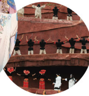
上戏合作 楚辞戏曲