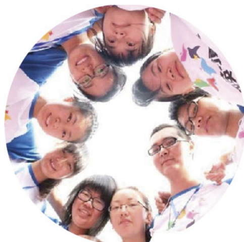
未来英才夏令营中快乐的志愿者

围绕公司“定投人生”的子品牌推广基金定投的科学理念，并举办丰富多彩的活动推动持有人参与和关注，如美丽定投俱乐部与瑞尔齿科联合举办牙齿健康讲座、绿芽定投俱乐部与知名教育机构“知心姐姐”开展暑期夏令营等儿童财智教育等。2013年全年，通过与知心姐姐俱乐部合作累计开展6场针对儿童理财的线下绿芽活动，赠送客户关于儿童教育及儿童理财相关书籍。