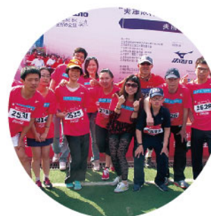
2013年4月，公司员工踊跃参加上海金桥8公里长跑活动