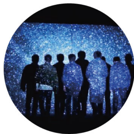
未来光锥2008升级盛典《达尔文》剧照