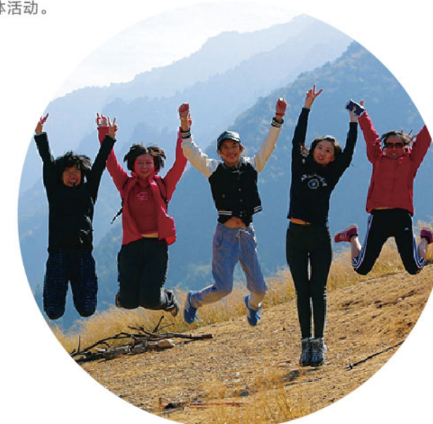
2013年金秋，公司部分新员工开赴徽杭古道徒步