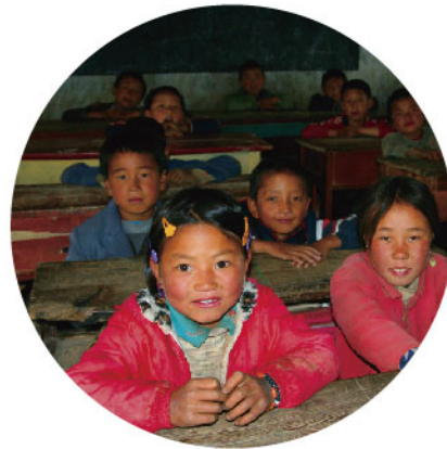
凉山彝族自治州贫困小学的同学们在艰苦的环境下快乐学习。凉山也是兴业全球重点支持的贫困地区

通过资源整合，2013年兴业全球基金加大推动了合作伙伴的共同发展，其中，与真爱梦想紧密合作，传播素质教育理念，促成真爱梦想与德邦证券、平和国际学校以及东方艺术中心的合作，并促成真爱梦想与兴业证券达成5年战略合作。同时不断推进教师培训项目从“走出来”到“送下去”，促成各类教育慈善基金会与光亚学校、云南教育基地和和平教育基地的合作。