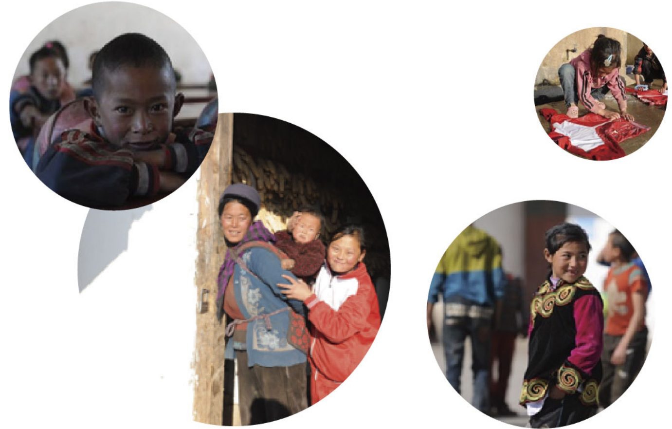
在兴业全球基金历年来的西部助学活动中受益的可爱同学们