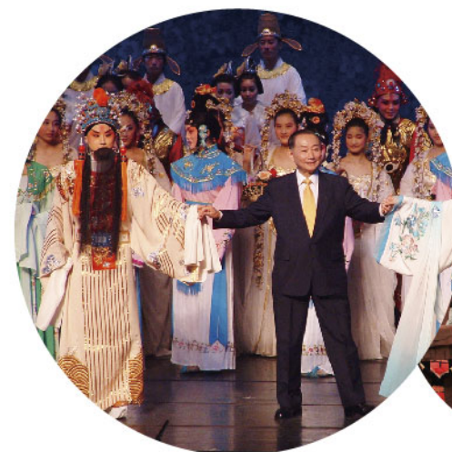
兴业全球基金与上戏合作《大唐贵妃2》 京剧表演艺术家梅葆玖登台亮相

兴业全球基金与上海戏剧学院的合作始于2009年，随后开展了一系列文化扶持项目：如启动牵手文化校园行活动，支持学生创新计划，支持暑期社会实践，设立“上戏兴业责任奖”等，以鼓励学生的艺术创新精神，培育有理想、有担当的艺术人才。