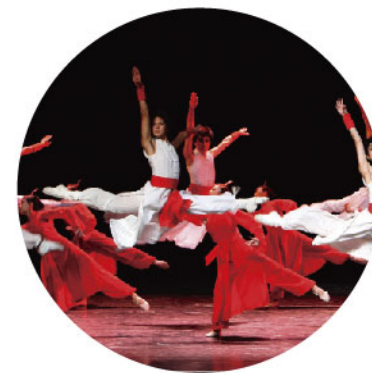
上戏合作 文化校园行