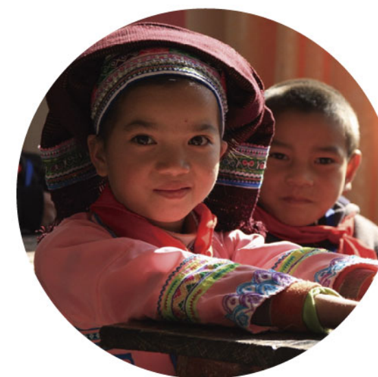
云南普格兴业责任 小学开学典礼上的 壮族学生