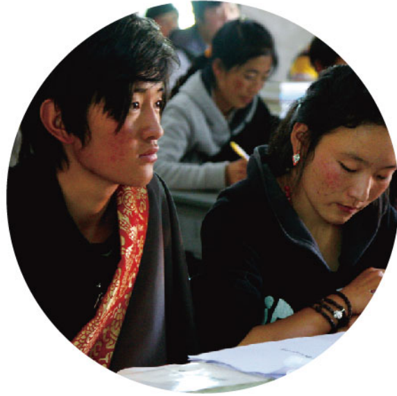
藏医班上认真学习的孩子。兴业全球基金多年来一直在资助藏医班贫困生，2013年资助106人。

善意传遍你我，温情感动人心。兴业全球基金很多员工也积极捐助了公司的多个公益项目，并积极参与到项目的具体实施中去，同时吸引了不少客户、客户家属、同行的爱心参与。借助兴业全球基金搭建的社会公益平台，更多的人开始关心社会公益、参与社会公益。