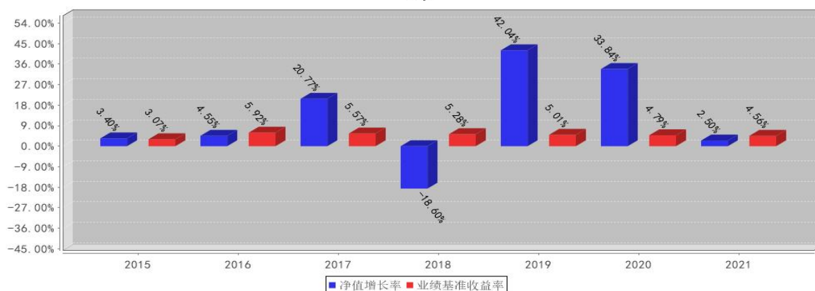
兴全新视野定期开放混合型发起式基金每年净值增长率与同期业绩比较基准收益率的对比图(2021年12月31日)

注：1、2015年数据统计期间为2015年7月1日（基金合同生效之日）至2015年12月31日，数据按实际存续期计算，不按整个自然年度进行折算。