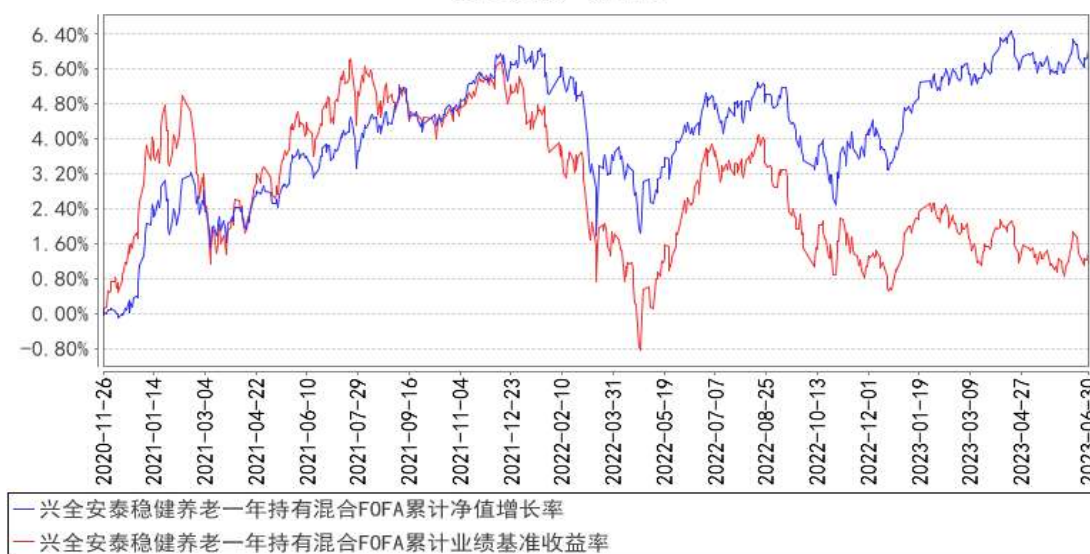
兴全安泰稳健养老一年持有混合FOFA累计净值增长率与同期业绩比较基准收益率的历史走势对比图