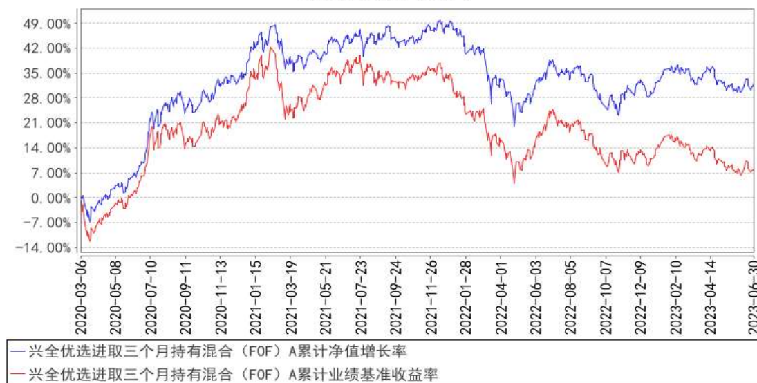
兴全优选进取三个月持有混合（FOF）A 累计净值增长率与同期业绩比较基准收益率的历史走势对比图