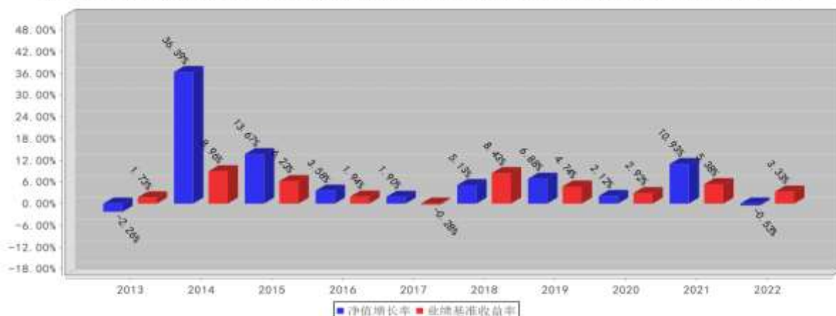
兴全磐稳增利债券A基金每年净值增长率与同期业绩比较基准收益率的对比图（2022年12月31日）