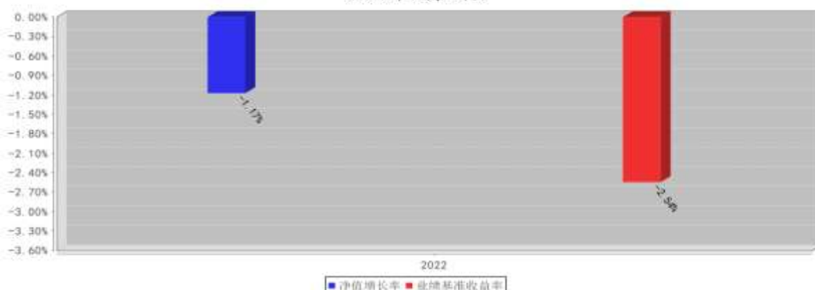
兴证全球优选平衡三个月持有混合（FOF）C基金每年净值增长率与同期业绩比较基准收益率的对比图 （2022年12月31日）

注：1、本基金于2022年9月5日公告增设C类基金份额，C类份额的2022年数据统计期间为2022年9月5日至2022年12月31日，数据按实际存续期计算，不按整个自然年度进行折算。