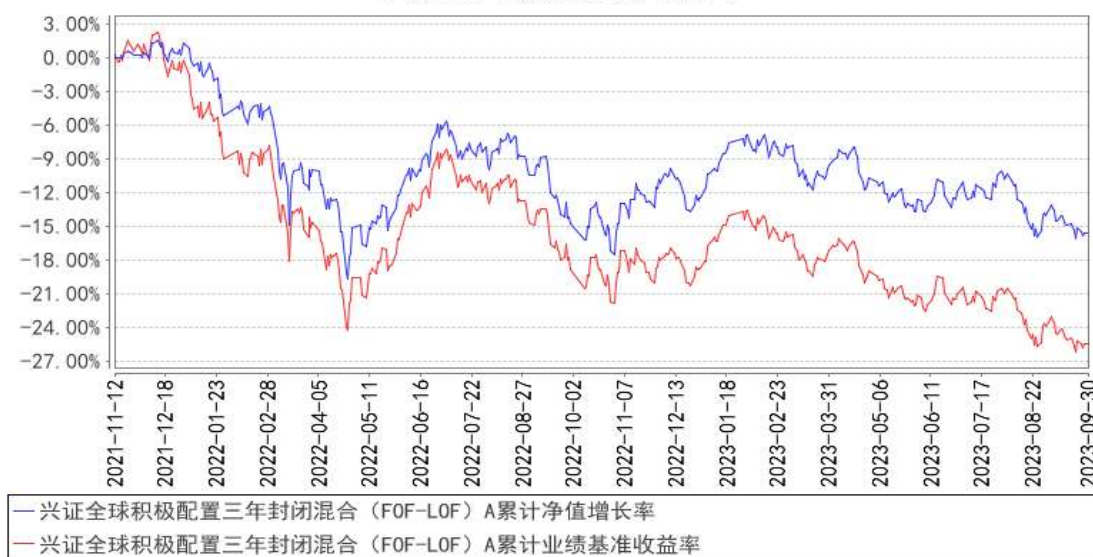
兴证全球积极配置三年封闭混合（FOF-LOF）A 累计净值增长率与同期业绩比较基准收益率的历史走势对比图