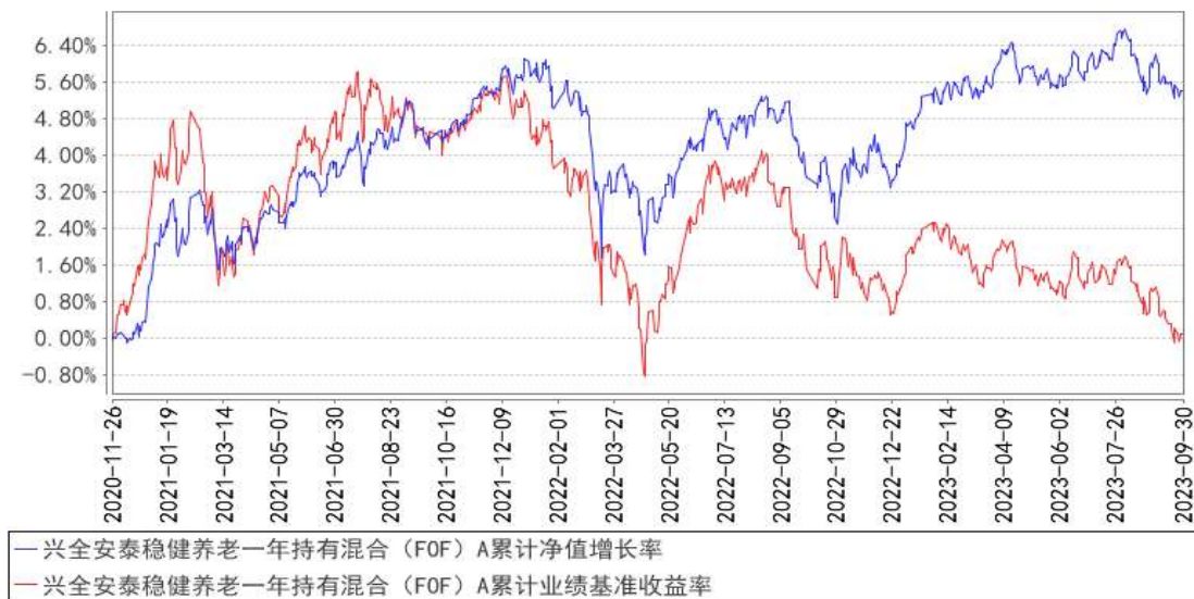
兴全安泰稳健养老一年持有混合（FOF）A 累计净值增长率与同期业绩比较基准收益率的历史走势对比图