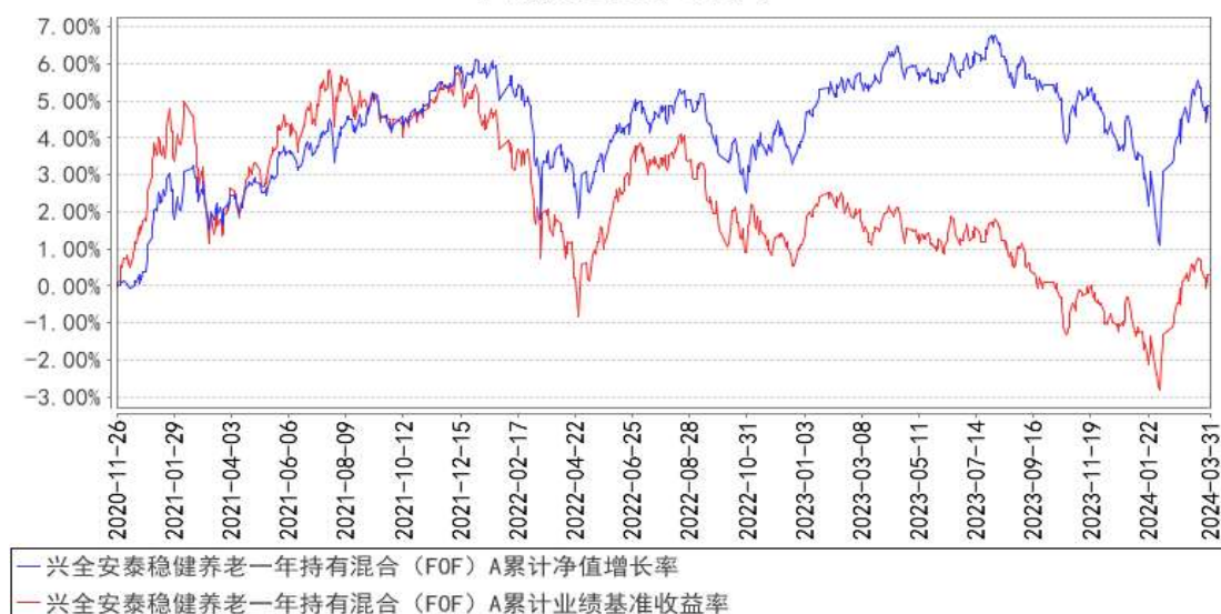
兴全安泰稳健养老一年持有混合（FOF）A累计净值增长率与同期业绩比较基准收益率的历史走势对比图