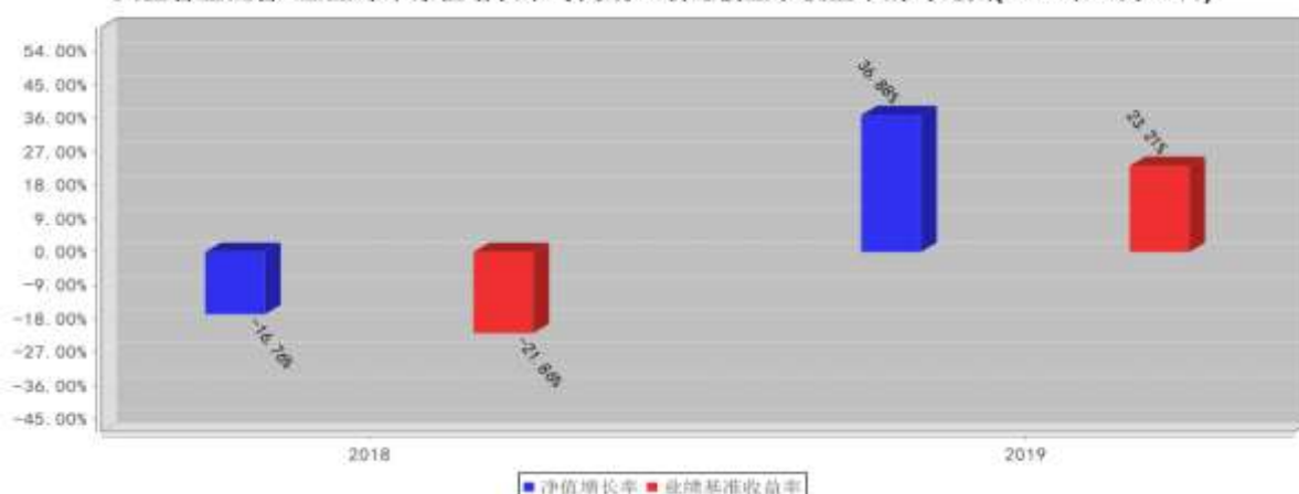
兴全合宜混合A基金每年净值增长率与同期业绩比较基准收益率的对比图(2019年12月31日)