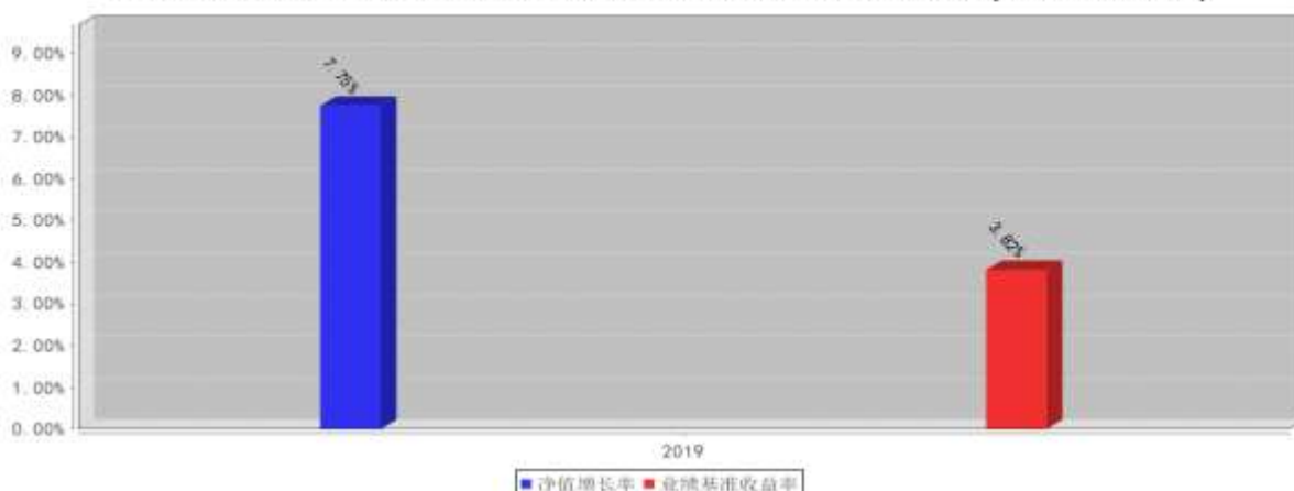
兴全合泰混合A基金每年净值增长率与同期业绩比较基准收益率的对比图(2019年12月31日)

注:1、2019年数据统计期间为2019年10月17日(基金合同生效之日)至2019年12月31日,数据按实际存续期计算,不按整个自然年度进行折算。