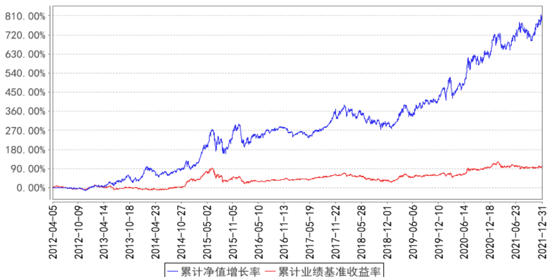
兴全轻资产混合（LOF）累计净值增长率与同期业绩比较基准收益率的历史走势对比图